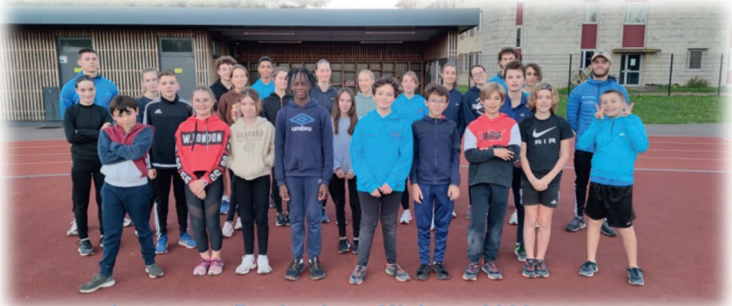
Le groupe Benjamins - Minimes 2023

Un sport individuel qui se pratique aussi par équipe : chaque saison le club participe au Challenge régional Equip'Athlé, tous peuvent participer, pas de sélection entre les jeunes