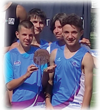
Podium régional en Relais

Objectifs : développer les qualités physiques de base et initier aux techniques spécifiques